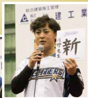
今季の目標を 漢字1文字で発表