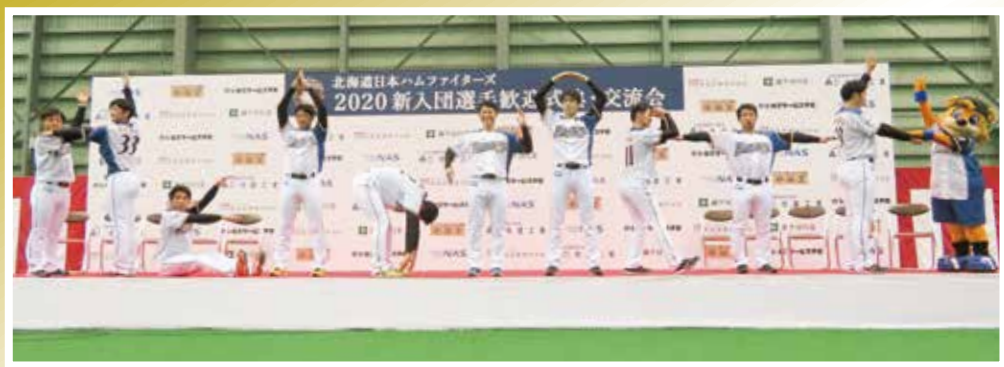
毎年恒例の人文字。ファームのスローガンである「HEAD NORTH」を表現しました