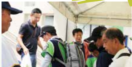
プレゼントの様子