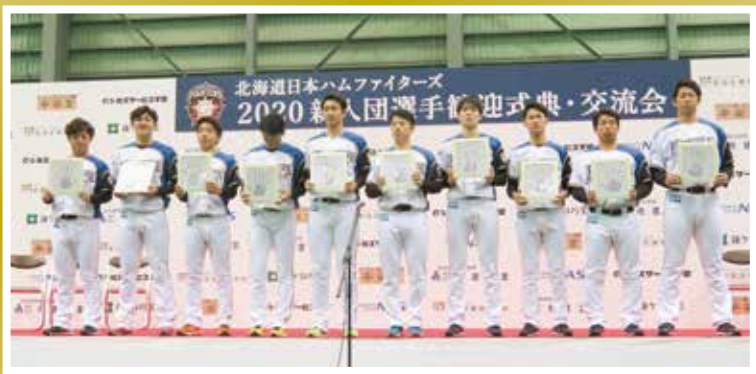
それぞれの手形を見せる新入団選手