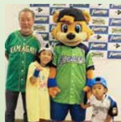
子供参加イベント