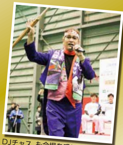
DJチャス。も会場を盛り上げました