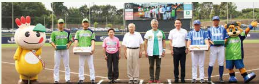
セレモニーの様子