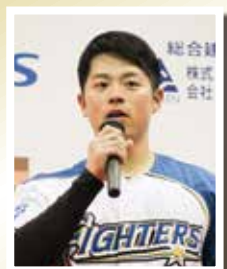
緊張の中あいさつ