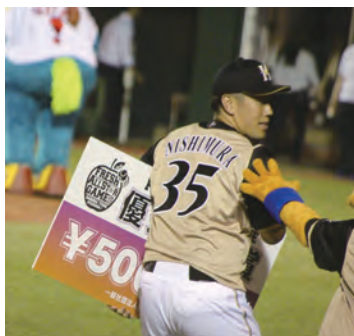
「ちょっとちょっと」