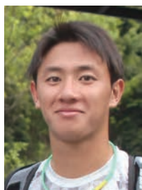
高山投手 (大阪桐蔭)大阪代表

みんな甲子園に出場した話をしていと思うんですが、甲子園は一度も出ていないんです。コール