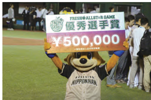
「賞金はカビーののですのて。」