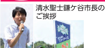
清水聖士鎌ケ谷市長のご挨拶