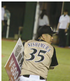
「賞金はいただいたぜ！」