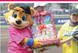
商工会でプッシュしている新商品 梨アイス・梨シャーベットをPRしました。