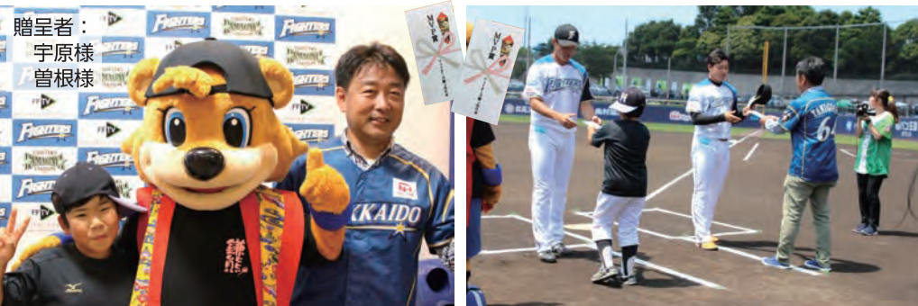
今回は記念撮影中にカビーが登場。大変お喜びいただけました。今後ともファイターズ鎌ケ谷の会を宜しくお願いいたします。

会員特典 ファイターズ鎌ケ谷の会 会員様より抽選で選ばれた方に贈呈して頂いております。