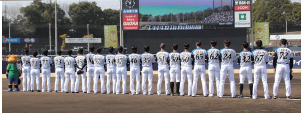
背番号が熱い! 頑張れ!