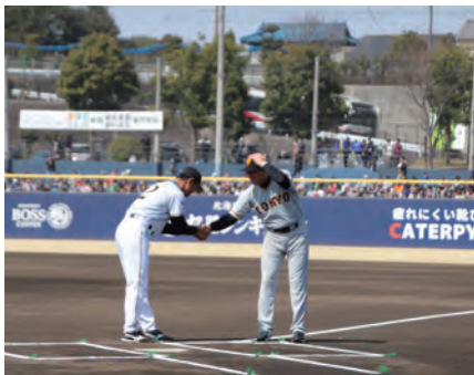
満員の対読売ジャイアンツ戦