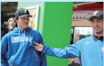
立田投手と屋宜投手