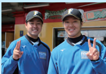
堀投手と玉井投手