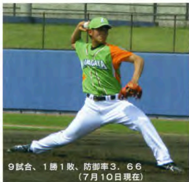
9試合、1勝1敗、防御率3.66 (7月10日現在)

「さて前半戦を終わって結果が出てきました。後半戦はメンタルな部分でどのように心掛けていきますか？ 平常心で投げられたら良いな