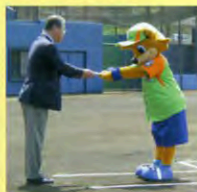
※矢貫投手は表彰当日に先発、尾崎選手は一軍登録のためカビーが代理で受賞しました。

矢貫投手 4試合 4勝 19 1/3回 自責点 1 防御率 0.93 尾崎選手 9試合 32打数 11安打 8打点 3本塁打 打率 .344 長打率 .719 出塁率 .417